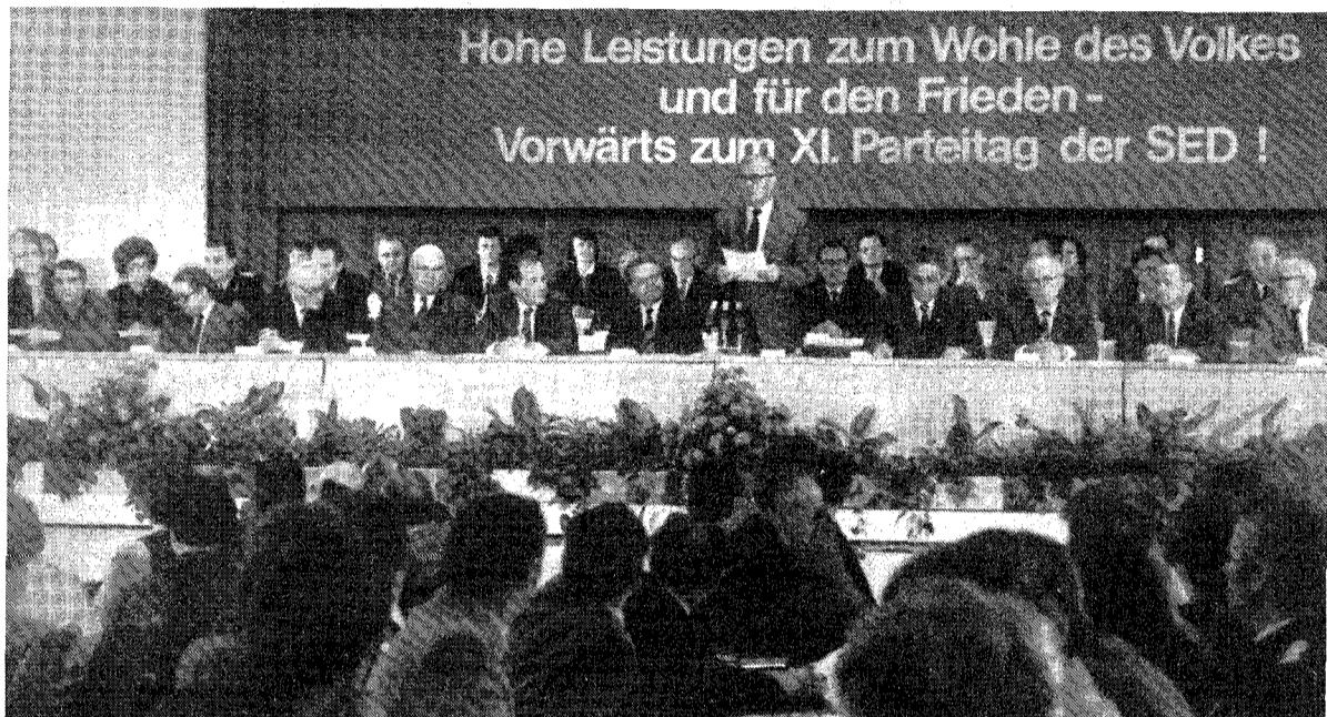
Tagung des Nationalrates in der Berliner Kongreßhalle

Berlin (ND). Der Nationalrat der Nationalen Front der DDR berief und beschloß am Freitag auf einer erweiterten Tagung in Berlin die Aufgaben der sozialistischen Volksbewegung zur Vorbereitung des XI. Parteitages der SED. In einem Brief an den Generalsekretär des ZK der SED und Vorsitzenden des Staatsrates, Erich Honecker, versicherte die Teilnehmer der Tagung, daß die im Bündnis in der Nationalen Front der DDR unter Führung der SED zusammenwirkenden gesellschaftlichen Kräfte sich aktiv an der umfassenden Volksausssprache zur Vorbereitung dieses herausragenden gesellschaftlichen Höhepunktes im Leben der DDR beteiligen werden. Das Arbeitsprogramm der Nationalen Front wurde vom Präsidenten des Nationalrates, Prof. Dr. Dr. Lothar Kolditz, begründet, der erklärte: „Der XI. Parteitag der SED wird Sache unseres ganzen Volkes sein, seine Vorbereitung ist jetzt Grundlage unseres gemeinsamen Handelns.“ In der Aussprache nahmen Repräsentanten der Parteien und Massenorganisationen sowie Vertreter von Ausschüssen das Wort. Für die SED sprach Joachim Herrmann, Mitglied des Politbüros und Sekretär des ZK der SED.