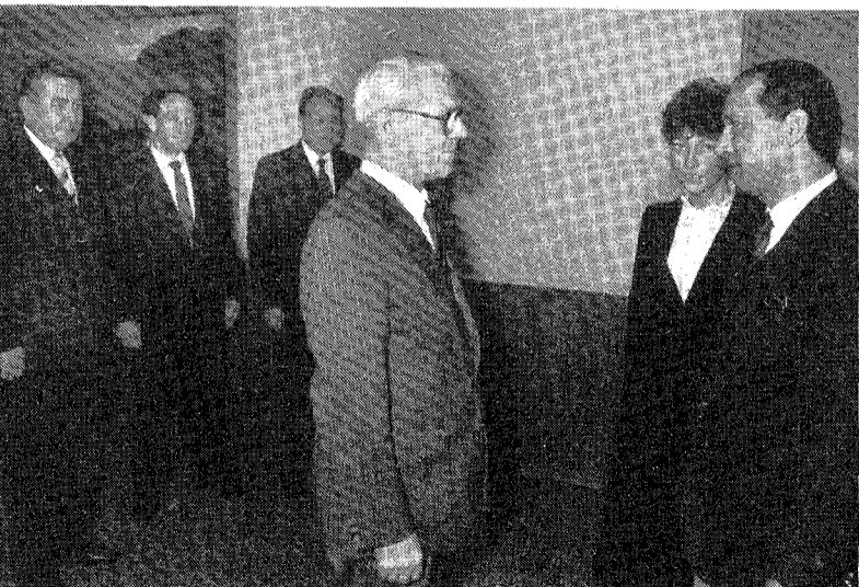
Freundschaftliche Begegnung im Ministerrat der DDR

Minister der ARA bei Willi Stoph / Ausbau gegenseitig vorteilhafter ökonomischer Beziehungen wurde gewürdigt